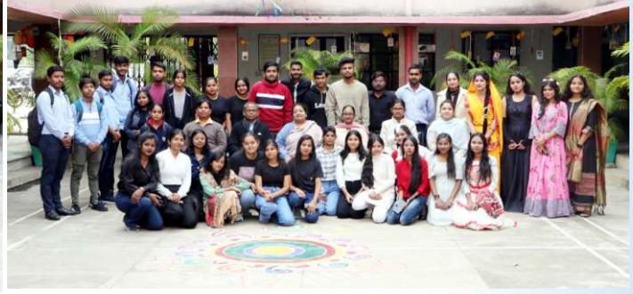
Sahityashala: Guests with Principal, Teachers and Participating Students