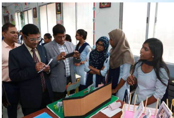
Guests visiting Commerce Exhibition