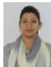
Ms. Ayushi Assistant Professor