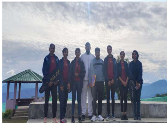
Badminton Team (W) in Nagaland for Inter-University Tournament