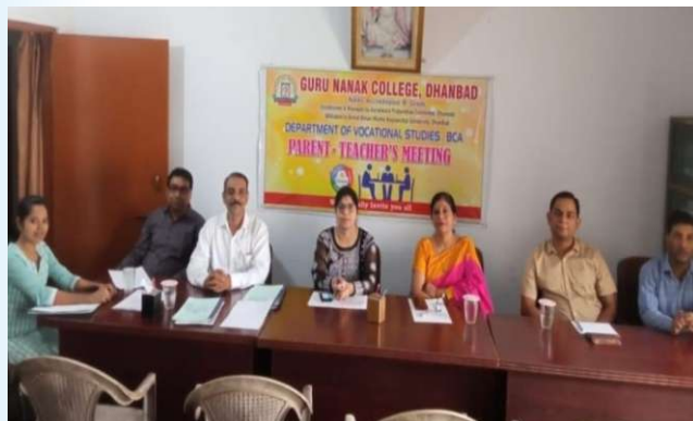
PTM (BCA) 2 nd July, 2023