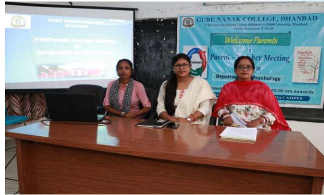
PTM (Psychology) 10th September, 2023