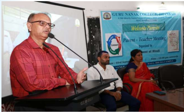
PTM (Hindi) 3 rd September, 2023