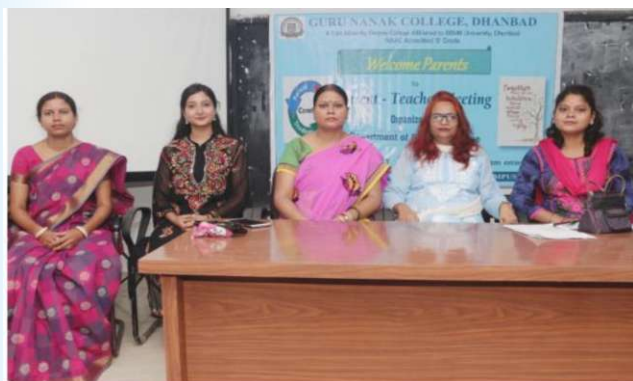
PTM (Political Science) 27 th August, 2023