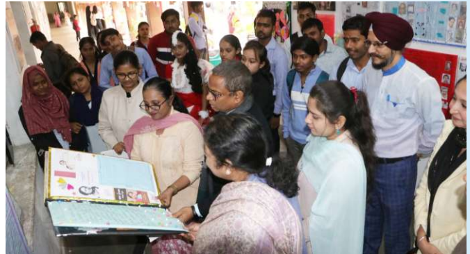
Guests visiting the exhibition during Sahityashal