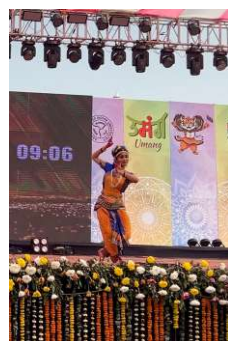
GURU NANAK COLLEGE, DHANBAD PARTICIPANTS OF 37th INTER UNIVERSITY ZONE YOUTH FESTIVAL "उमंग" AT BEHRAMPUR ORISSA 16th - 20th FEBRUARY, 2024