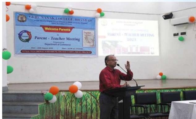
PTM (Commerce) 20th August, 2023