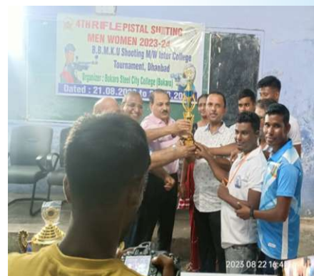
Air Rifle Shooting