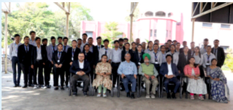
College Administration with Faculty Members and Students of BBA

In the contemporary era marked by globalization and significant economic expansion, organizations, both profit-seeking and non-profit-seeking, are experiencing remarkable growth in their operations. This expansion necessitates individuals with managerial expertise and skills to navigate the complexities of modern business environments. With higher positions predominantly of administrative nature, coupled with the rise of startups and entrepreneurship, there's a clear demand for proficient managers. Consequently, there has been a surge in the pursuit of managerial education, with individuals with technical backgrounds often opting to enhance their capabilities through programs like MBA.