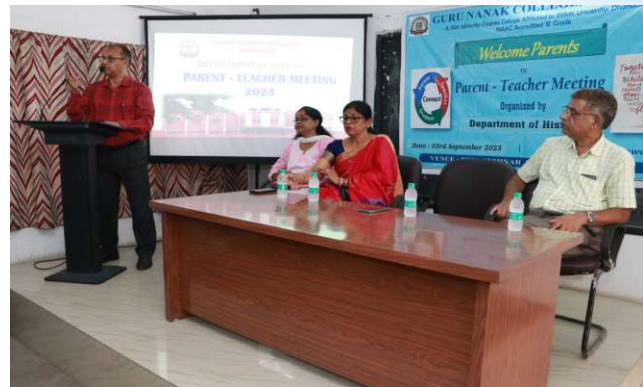
PTM (History) 3 rd October, 2023