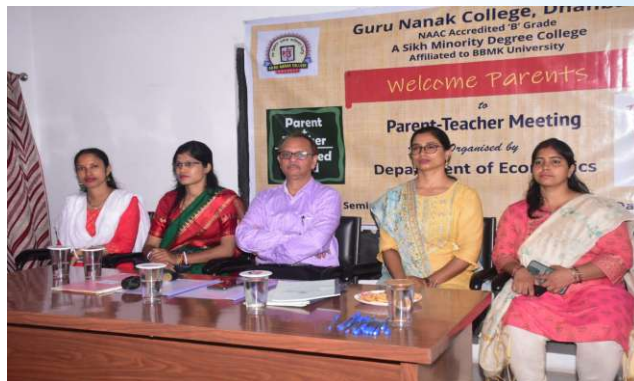
PTM (Economics) 27 th August, 2023