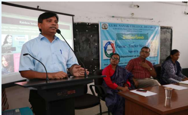
PTM (English) 10 th September, 2023